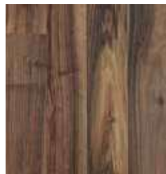
AUSTRALIAN WALNUT TS4SP8-7503-A