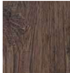
REVOLUTION OAK TS4HE10-34029-A