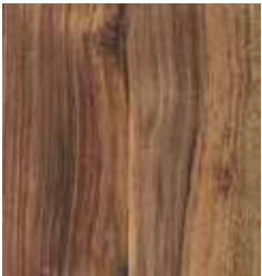
AUSTRALIAN WALNUT TS4PS7-7503-A