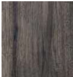
DEMOCRACY OAK TS4HE10-34135-A