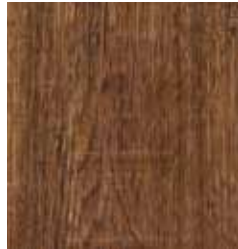
PLANTATION OAK TS4HE10-34074-A