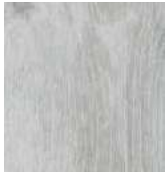
ARCTIC OAK TS4PS7-4011-A