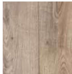
OAK DESIGN TS4PS7-7844-A