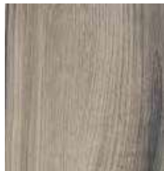
OAK SOLANO TS4EV8-5576-A