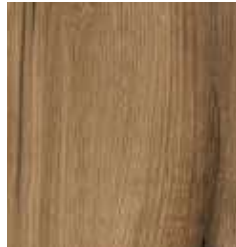
OAK SUNSET TS4EV8-5574-A