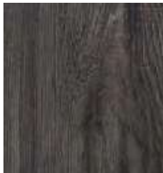
INDEPENDENCE OAK TS4HE10-34054-A