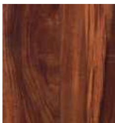
MONTECARLO ACACIA TS4M10-30590-A