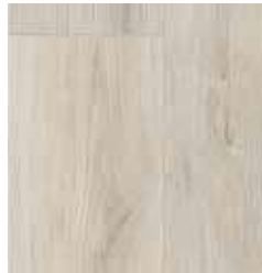
OAK SIGNA TS4EV8-4419-A