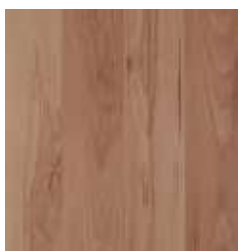
MOUNTAIN BEECH TS4SP8-2535-A