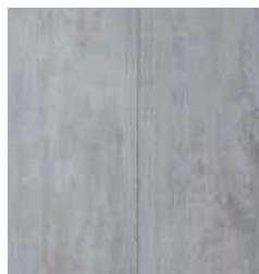
ARCTIC OAK TS4SP8-4011-A