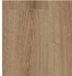
OAK VOGUE TS4EV8-4421-A