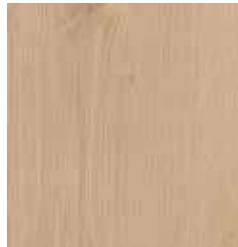
OAK CRYSTAL TS4EV8-4423-A