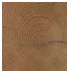
OAK FRESCO TS4AS8-4381-A