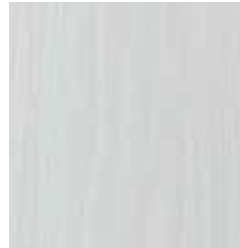
IVORY WHITE TS4PS7-7582-A