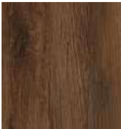
GOLDEN OAK TS4PS7-4898-A