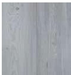
SILVER KIEFER TS4SP8-5266-A