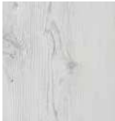
ST. REMY TS4EV8-4053-A