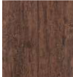
HICKORY FOREST TS4CL7-3844-A