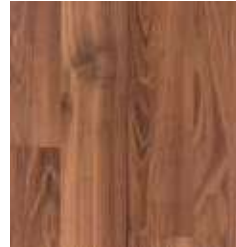
NOGAL AMERICANO TS4PS7-7671-A