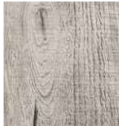
CABANA LAGOS TS4SH7-2217-A