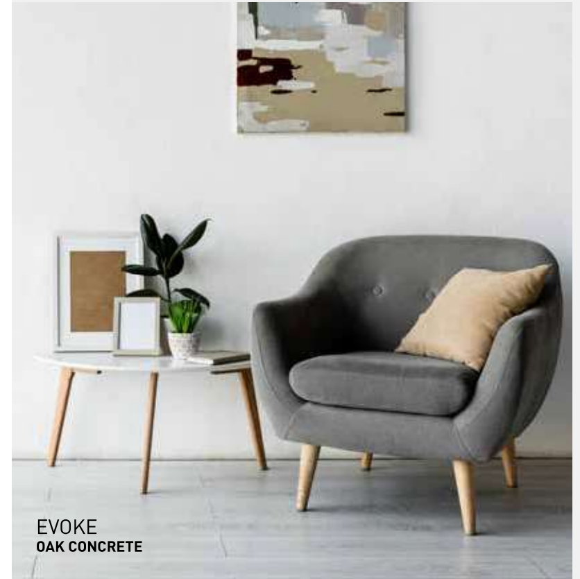
EVOKE OAK CONCRETE