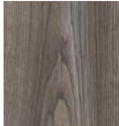
COPPER OAK TS4SH7-7197-A