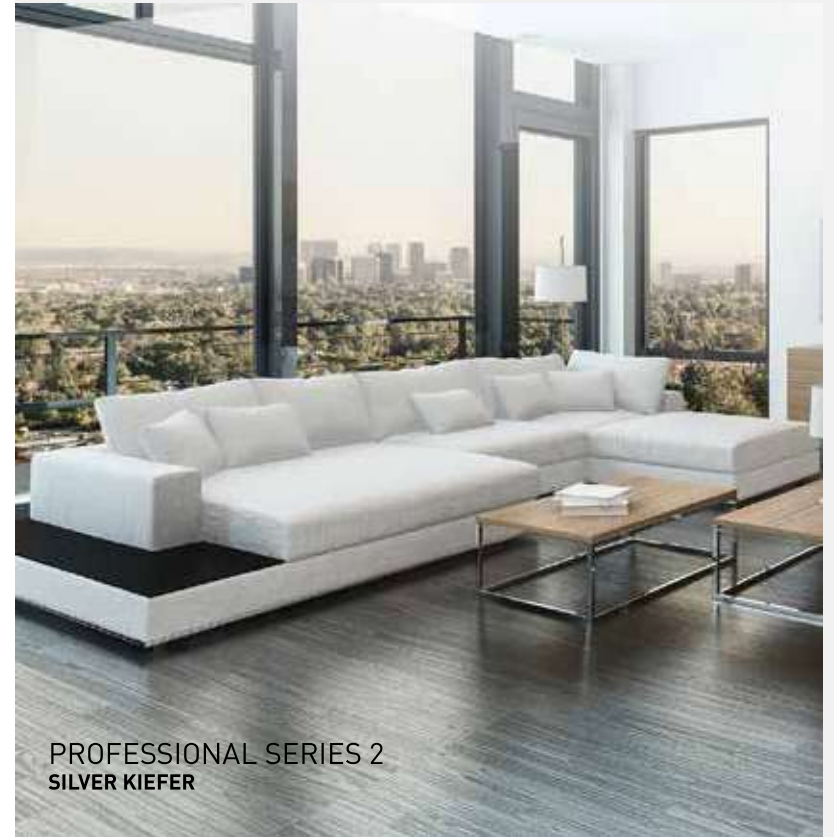
PROFESSIONAL SERIES 2 SILVER KIEFER