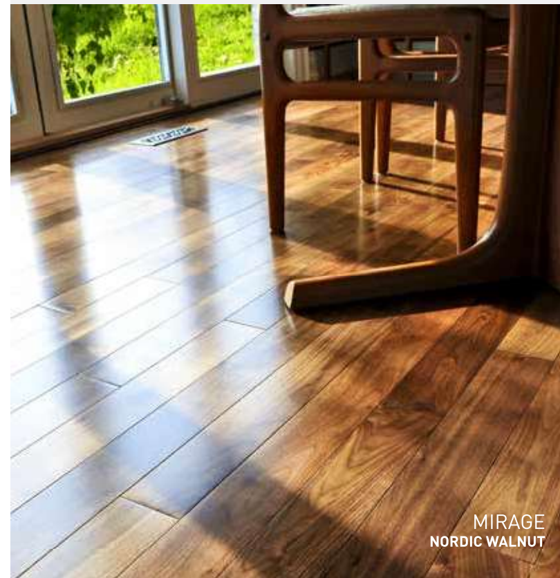
MIRAGE NORDIC WALNUT