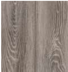
OAK THUNDER TS4PS7-4009-A