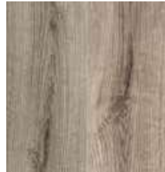
OAK TREND TS4PS7-4424-A