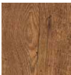
OAK EARTH TS4DS7-7302-A