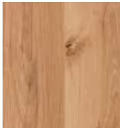
MOUNTAIN BEECH TS4PS7-2535-A