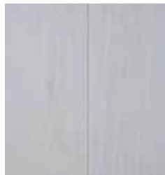
IVORY WHITE TS4SP8-7582-A