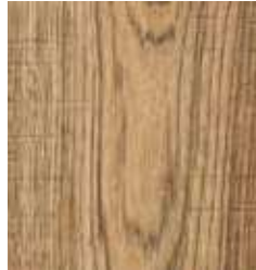
COLONIAL OAK TS4HE10-34073-A