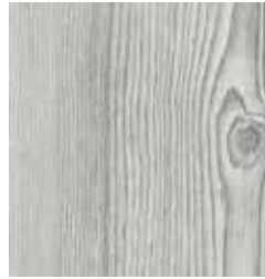
SILVER KIEFER TS4PS7-5266-A