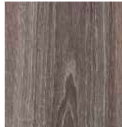
OAK SILEA TS4CL7-7527-A