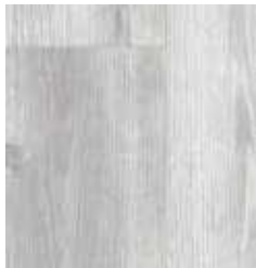
OAK CONCRETE TS4EV8-4422-A