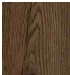
OAK EPIC APULIEN TS4DS7-5845-A