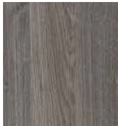
TITANIUM OAK TS4SH7-7718-A