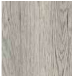
HICKORY CAROLINA TS4SH7-5756-A