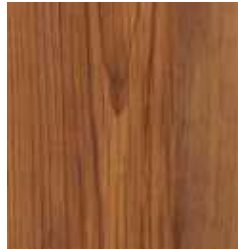
SPRUCE ANTIQUE TS4CL7-3346-A