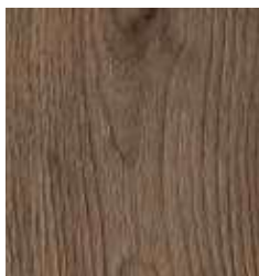
WALNUT SABO TS4DS7-4367-A