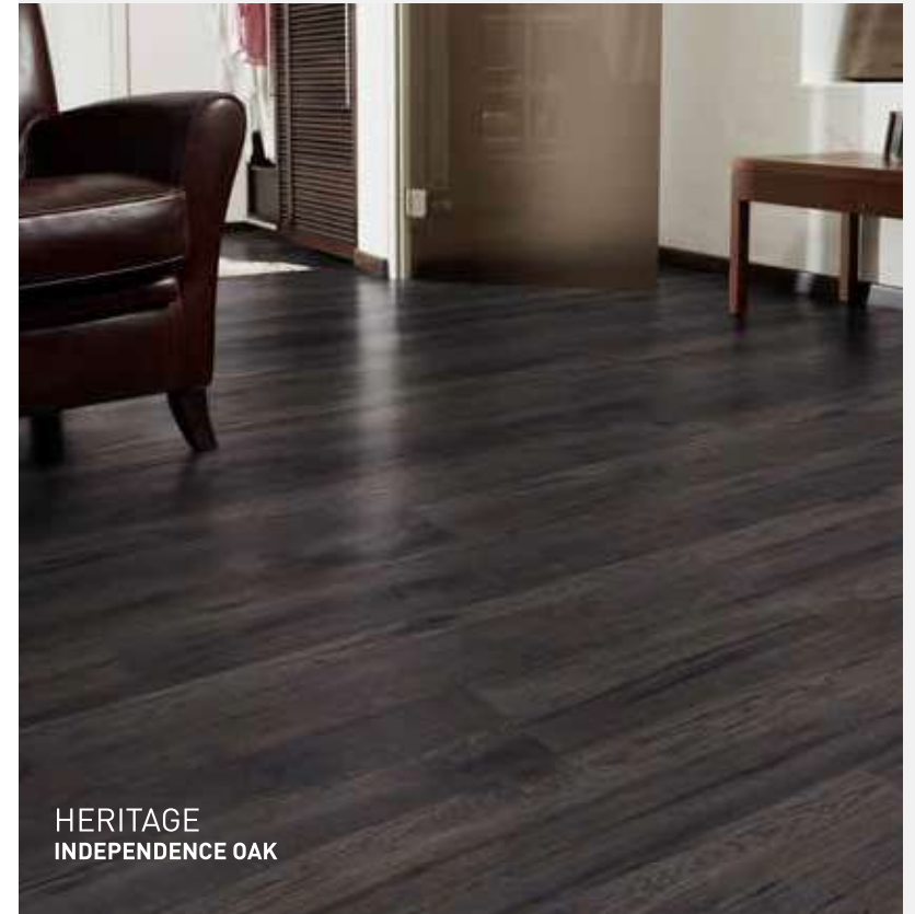
HERITAGE INDEPENDENCE OAK