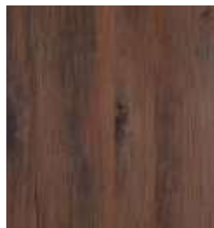
GOLDEN OAK TS4SP8-4898-A