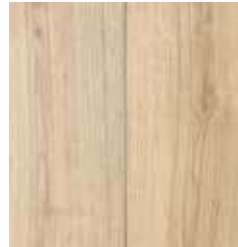
OAK NATURAL TS4PS7-4420-A