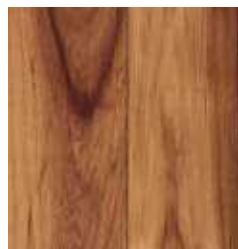
NORDIC WALNUT TS4M10-10361-A