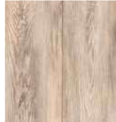
KIEFER STORM TS4PS7-4075-A