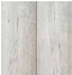
OAK VIENNA TS4PS7-4369-A