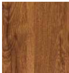
OAK SOUL TS4DS7-3709-A