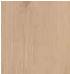
OAK EVOKE CRYSTAL TS4CL7-4423-A