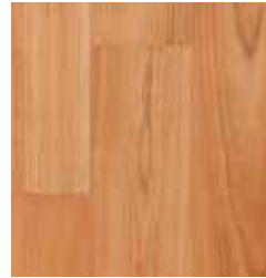
CEREZO TABLA TS4PS7-7612-A