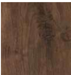
OAK BREEZE TS4AS8-4382-A